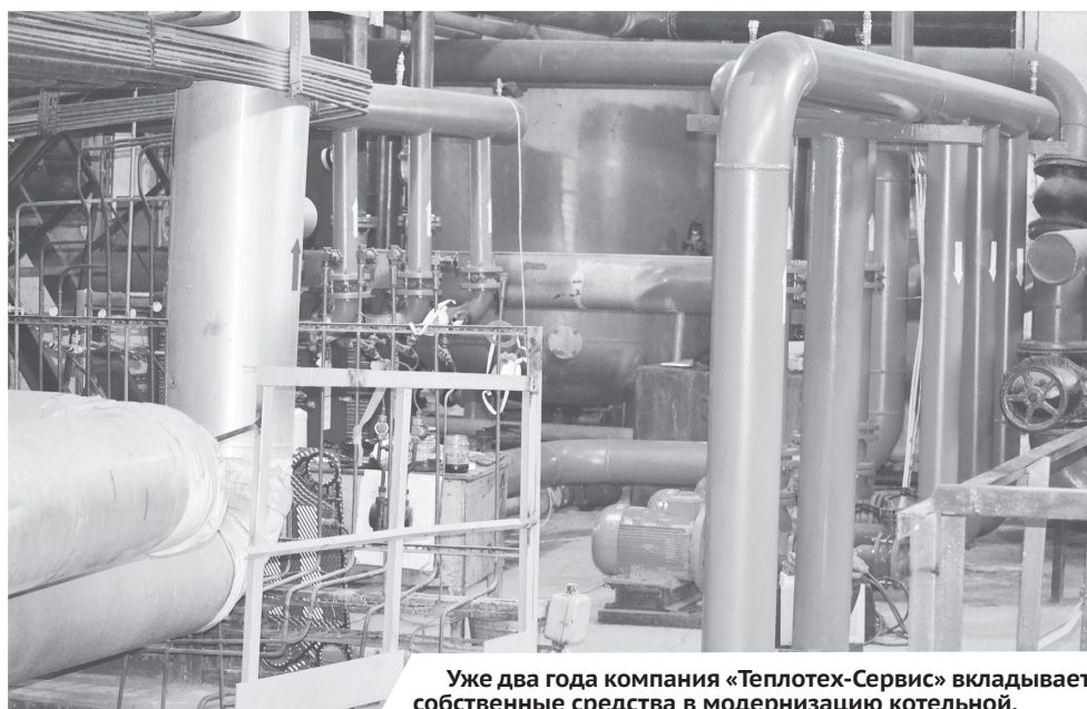
Уже два года компания «Теплотех-Сервис» вкладывает собственные средства в модернизацию котельной.

Компания «Теплотех-Сервис» выполнила все, что обещала, и теперь ждет ответной реакции от жителей